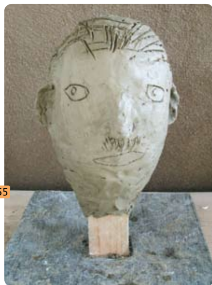
Portretul cel mai simplu pe care îl poți face este așa: iei un boț de lut îl modelezi